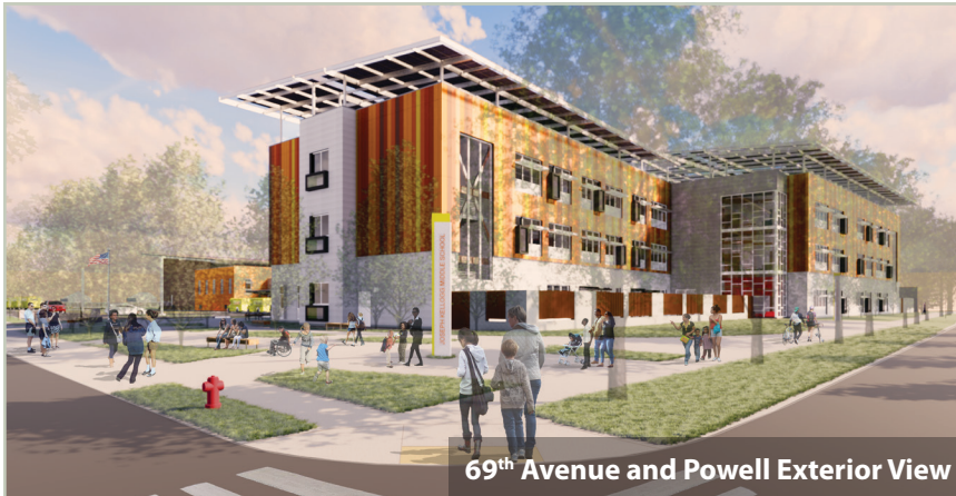
69 th Avenue and Powell Exterior View