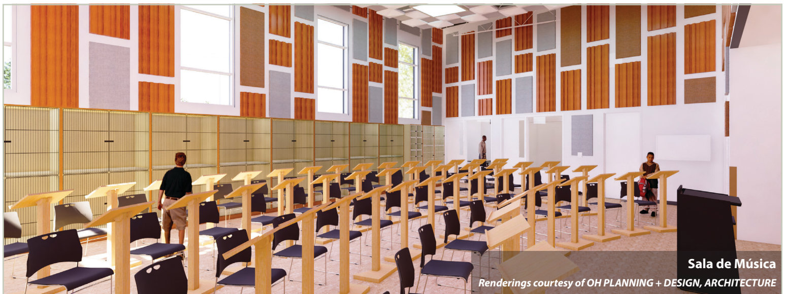
Sala de Música