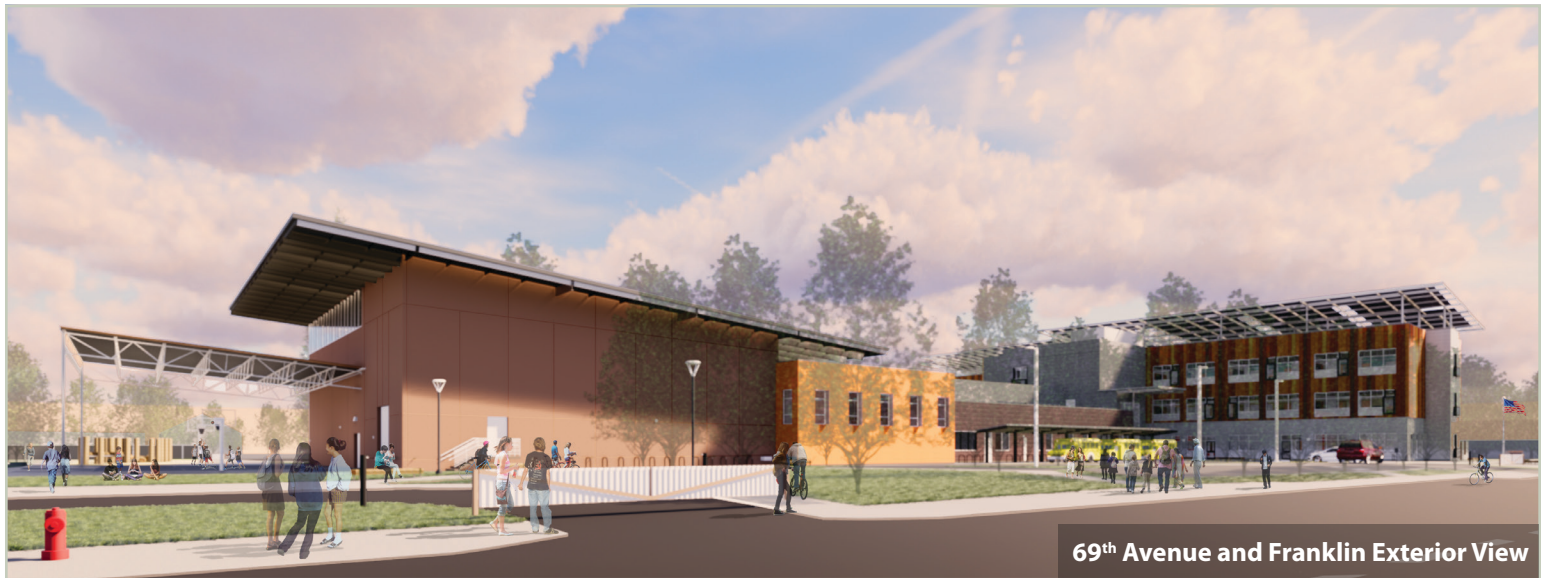
69 th Avenue and Franklin Exterior View